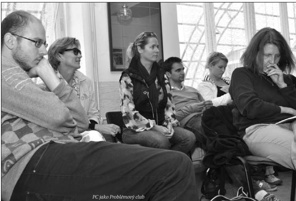
PC jako Problémový club