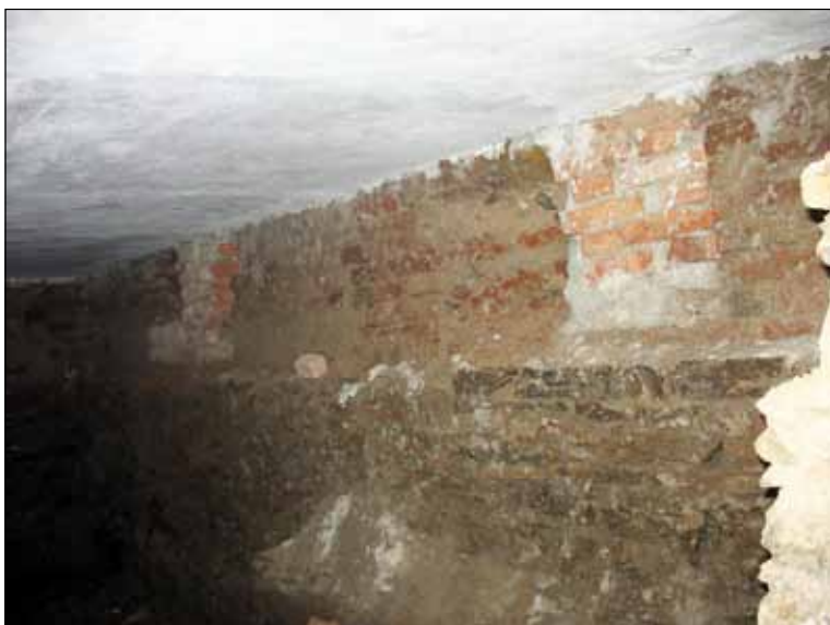
Zed' k místnosti 5

V prostoru vpravo od vstupu, při zdi do dvora, je možné umístit experimenty – jednoduchý stav, karetkování, poster s postupem tkaní, monitor s promítáním ukázek tkaní, karetkování a jiných pravěkých technik. Texty a popisky budou umístěny na stěně vpravo, další na informačních tabulkách nad každým sloupkem zábradlí.