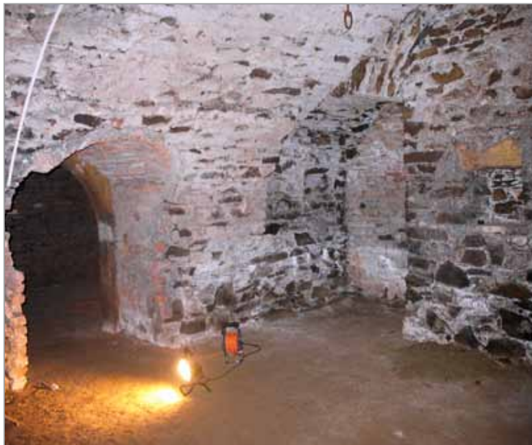
Prostor pro vitrínu č. 2