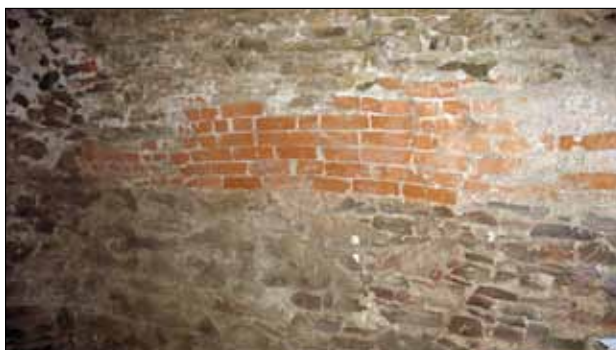
Prostor pro vitrínu č. 8

Soubor keramiky , železný náramek (Moravičany – pohřebiště), části železných a bronzových spon (Moravičany, Obersko), bimetalické a železné šperky, kování, trojhranné skýtské šipky (do pozadí text o Skýtech – 7. stol.), železné koňské udidlo, nůž. oštěp; soubor kultovní keramiky z pohřebiště u Moravičan, štěrchátka, svastiky, kolečka; doklad obchodu – závěsek v podobě zvířete z Mohelnice, skleněné a jantarové korálky z Mohelnice, atd.