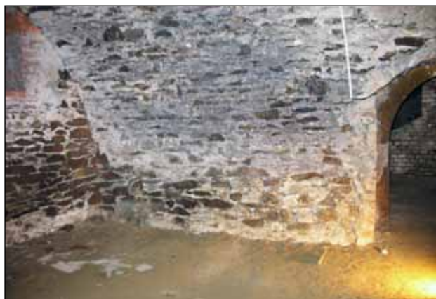
Prostor pro vitrínu č. 4

Vitrína V4 - podél zdi, celoskleněná, dole usazená do cihlového soklíku S6 o rozměrech 350 cm x 75 cm x 30 cm. Skleněná část vitríny bude nahoře uchycena do klenby kovovými úchyty s grafitovým nátěrem, police skleněné, uchycené na trny do zdi (rozmístění dle exponátů), celková výška vitríny cca 210 – 230 cm (ukončení do klenby), délka 350 cm, šířka 75 cm.