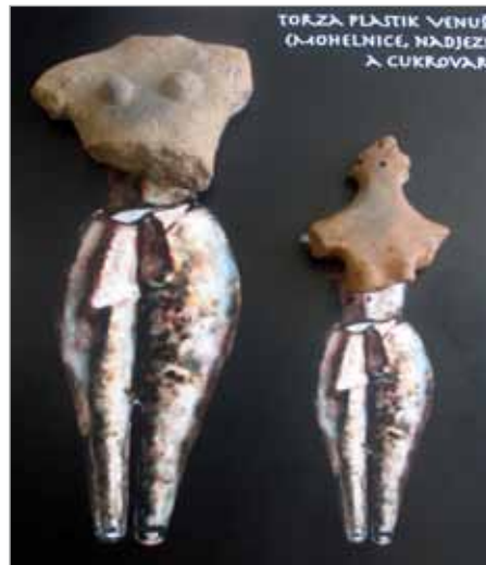
Vitrína č. 3