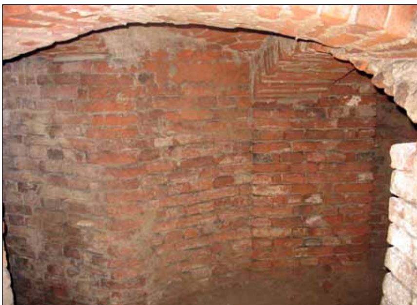
Prostor pro vitrínu č. 1

Vitrína V1 – kopie venuší a jiných nálezů z paleolitu. Panel 60 cm x 10 cm x 50 cm, zhotovený z překližky do vlhka, matný černý povrch, přeskleno sklem o rozměrech 60 cm x 50 cm, uchycení kovovými trny s grafitovým nátěrem. Umístění vitríny při levé zdi před místností č. 1. Horní hrana vitríny bude ve výšce 168 cm.