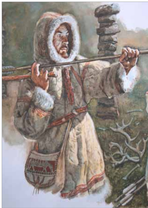
L. Balák – Magdalenien – vzor pro figurínu

Vitrína V1 – kopie venuší a jiných nálezů z paleolitu. Panel 60 cm x 10 cm x 50 cm, zhotovený z překližky do vlhka, matný černý povrch, přeskleno sklem o rozměrech 60 cm x 50 cm, uchycení kovovými trny s grafitovým nátěrem. Umístění vitríny při levé zdi před místností č. 1. Horní hrana vitríny bude ve výšce 168 cm.