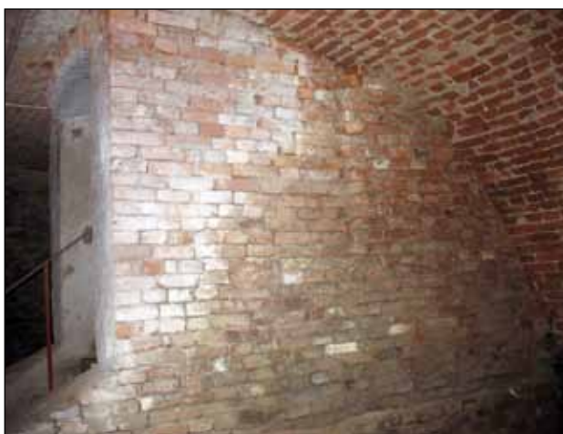
Prostor pro mapu

Na vnější zdi schodiště směrem k místnosti 1 a 2 bude umístěna mapa pravěkých nalezišť z regionu - interaktivní mapa. Je možné použít odolný displej s úhlopříčkou cca 108 cm opatřený „nacvakávací“ plochou, která umožní dotykovou obsluhu. K displeji je nutné pořídit i PC.