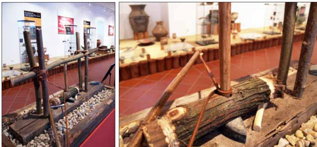
Vrtání kamene – funkční model

Pod obrazem model vrtání kamene – funkční model M3 na soklu S5 . Sokl – překližka do vlhka s černým nátěrem, rozměr 130 cm x 50 cm x 60 cm.