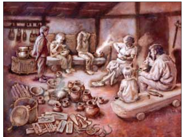
Průčelní stěna – L. Balák – poster, pod ním rekonstrukce hrobu

Vitrína V8 – při zdi k místnosti č. 6 (stejná jako vitrína č.7) – halštat, kultura platěnická.