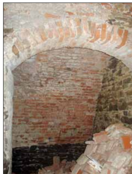
Prostor pro vitrínu č. 5