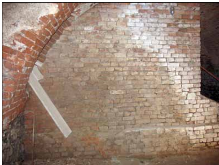
Prostor pro Dvoranu slávy