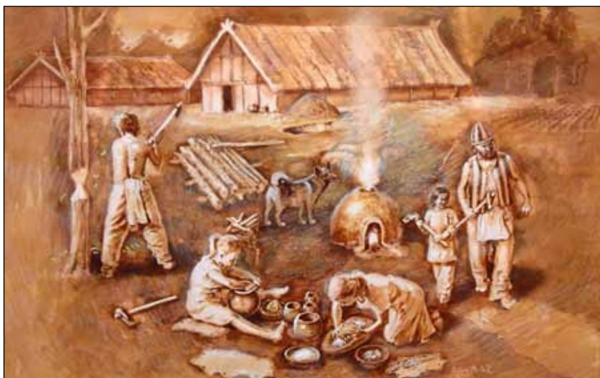
L. Balák – neolit

Na průčelí P3 – obraz od L. Baláka – neolit, polep na plexisklo, velikost 200 cm x 100 cm.