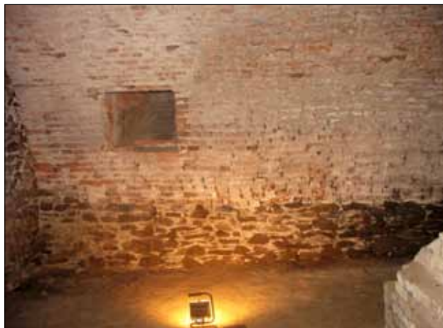
Místnost č. 4 – prostor pro úvodní postery a vývojovou řadu

Vstupní prostor nebude jako celek věnován žádnému období, aby nebyla porušena chronologie. Naproti vstupním schodům budou umístěny postery P4 – P10 uvozující jednotlivá období (paleolit, neolit, eneolit, doba bronzová, halštát, latén + doba římská, doba slovanská) – postery (samolepky na plast), rozměr cca 70 cm x 150 cm, zavěšené šikmo dle sklonu klenby – prostor pro postery je široký cca 500 cm, začíná min. 300 cm od zdi oddělující místnost č. 5 a končí u výklenku ve zdi směrem k místnosti 3 (190 cm od zdi). Pod postery bude umístěná vývojová řada keramiky a kamenných a kovových nástrojů. Sokly S7 – S12 budou zhotoveny z překližky do vlhka s matným černým povrchem, rozměry 70 cm x 50 cm x 50 cm, překryté celoskleněným poklopem – rozměry 70 cm x 50 cm x 40 cm.