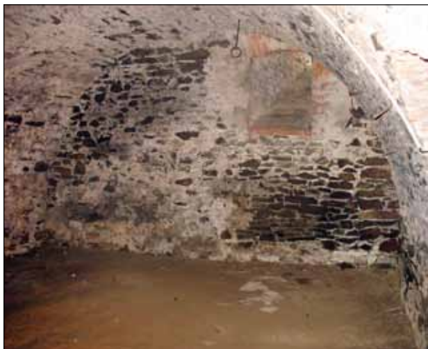
Průčelí – vrtání kamene

Na průčelí P3 – obraz od L. Baláka – neolit, polep na plexisklo, velikost 200 cm x 100 cm.