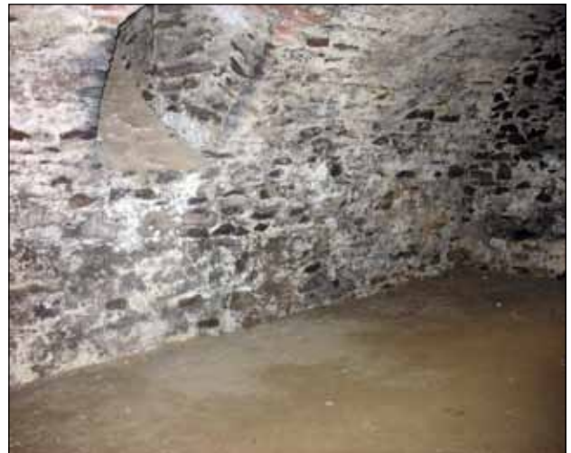
Prostor pro aranžovanou scénu