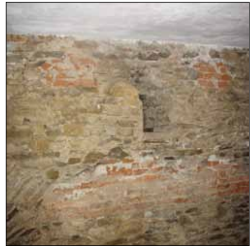
Prostor pro vitrínu č. 7 – stěna k místnosti 4

Průčelní (hradební) zeď – P16 obraz od L. Baláka – doba bronzová, samolepka na plast, 200 cm x 100 cm.