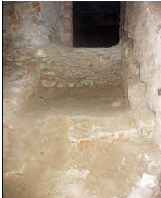
Schody k místnosti 6