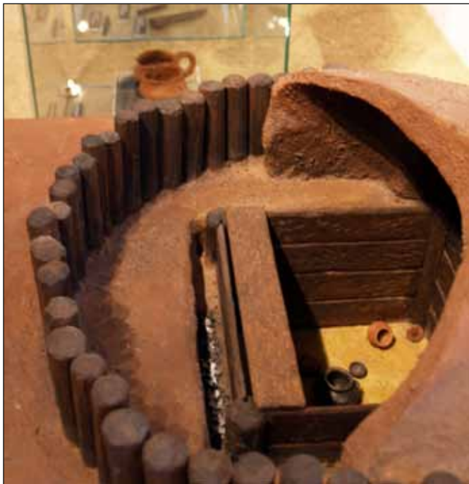
Model komorového hrobu

Model M6 komorového hrobu – na pokračujícím cihelném soklu (viz situace umístění modelu mohylového hrobu před vitrínou č.7) bude umístěn model velkého komorového hrobu z Moravičan. Rozměr modelu 60 cm x 80 cm. Model bude navazovat na vitrínu č. 8 a uzavře celé období. Nad ním bude na zdi P17 reprodukce obrazu od L. Baláka – halštatský pohřeb – samolepka na plast, 100 cm x 200 cm. Pak návštěvník pokračuje po schodech do místnosti č. 6.