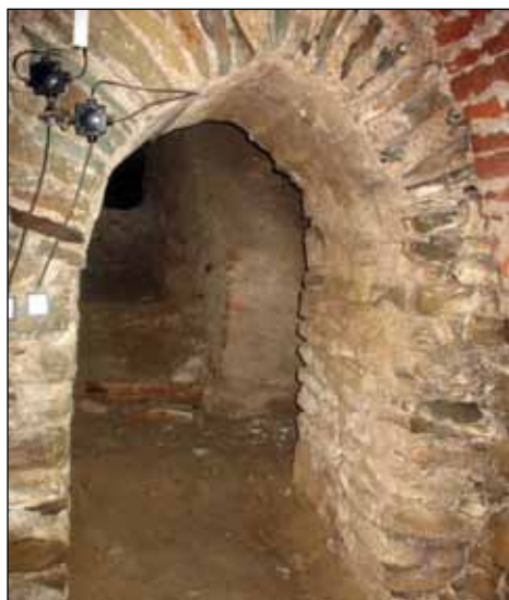
Průchod mezi 5 a 4

Bude sjednocena probíhajícím cihelným soklem S14 – S15 , vysokým 40 cm, ve tvaru písmene U, který bude obíhat kolem zdi (zeď k místnosti 4, hradba, zeď k místnosti 6 – viz výkres). Prezentace bude začínat modelem M4 mohylníku ze Stavenice (žárový pohřeb pod mohylou, mladší doba bronzová – delší text na zeď na plast), který bude postaven na cihelném soklu vlevo vedle vstupu. Rozměr modelu je 50 cm x 65 cm.