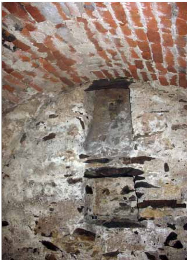
Místnost č. 2

Místnost č. 2 – aranžovaná scéna č. 2 – rekonstrukce mladopaleolitického obydlí – stanový přístřešek, figurína F1 lovce mamutů, na zemi naaranžované mamutí a zvířecí kosti. Figurína v životní velikosti, oděv dle obrazu L. Baláka. Délka plůtku a soklíku S2 od zdi ke zdi cca 150 cm.