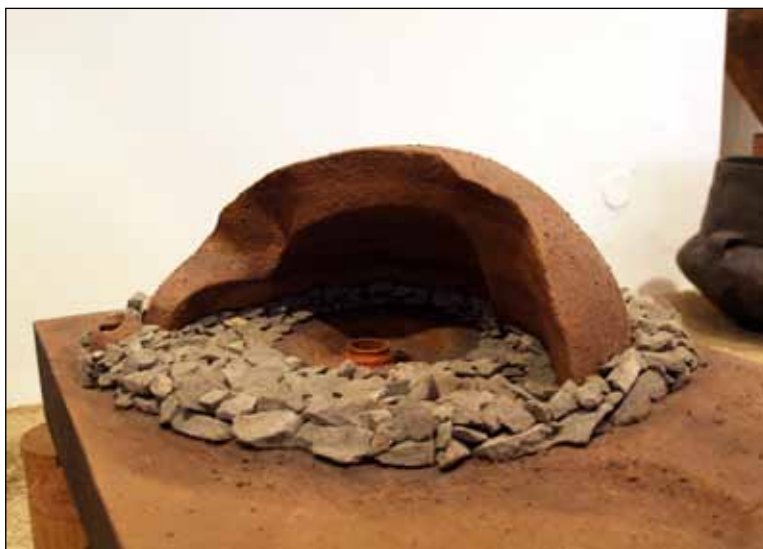
Model mohylníku ze Stavenice

Vitrína V7 – na pokračující cihelné podezdívce (při zdi k místnosti č. 4) bude následovat velká skleněná vitrína, skla budou dole ukotvena do podezdívky, nahoře do subtilní kovové konstrukce (matný černý nátěr). Police ze skla budou ukotveny přímo do zdi, jejich rozmístění podle exponátů. Délka vitríny 400 cm – až k hradební zdi, hloubka 60 cm, výška cca 200 cm (výška včetně soklu).