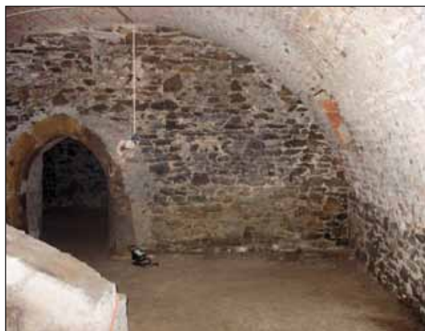
Prostor na hry

V prostoru pod větracím otvorem v rohu vnější obvodové zdi (hradby) a zdi k místnosti č. 3 je možné umístit interaktivní hry pro děti – skládačky, hra Lov mamutů, atd.