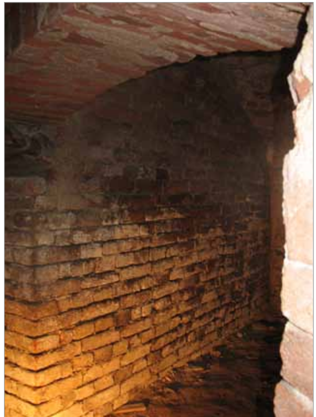
Místnost č. 1