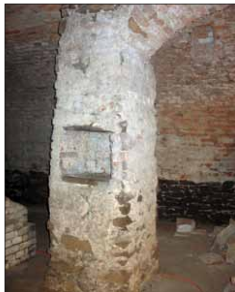
Prostor pro vitrínu č. 6