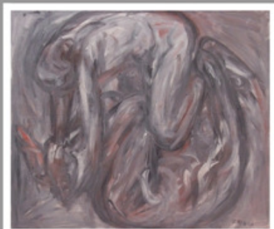
Kolíbka, olej na plátně, 135 x 125 cm, 2003