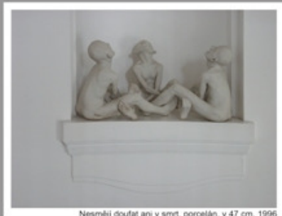
Nesměji doufat ani v smrt, porcelán, v 47 cm, 1996

Sládečkovo vlastivědné muzeum v Kladně Hufská 1375, Kladno 272 01 9. října - 14. listopadu 2010 úterý - neděle 9.00-12.00, 13.00-17.00 pondělí zavřeno, www.omk.cz kontakt: zdenek.manina@post.cz