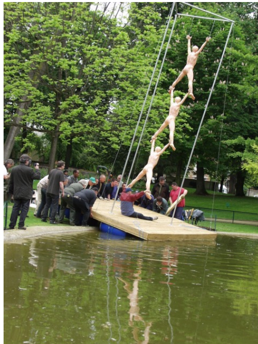
Foto: 1) reliéf „Rytmus“ z výstavy „Poletíme“ v Rabasově galerii v Rakovníku, 2000, (127 x 211 cm) 2) instalace soch „Rovnost“ v partnerském městě Kladna Vitry-sur-Seine, 2009, (500 cm)

1996 fontána, třída T.G.M., Kladno 1999 velkoplošné vitráže, bronzová plastika, Točná 2000 nástrovní malby, zámek Dětenice 2001 rekonstrukce malby na plech - Ukřížování, Kladno 2002 fontána, třída T.G.M. Kladno, společně s Ing.arch. P. Šulcem