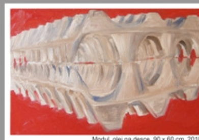
Modul, olej na desce, 90 x 60 cm, 2010