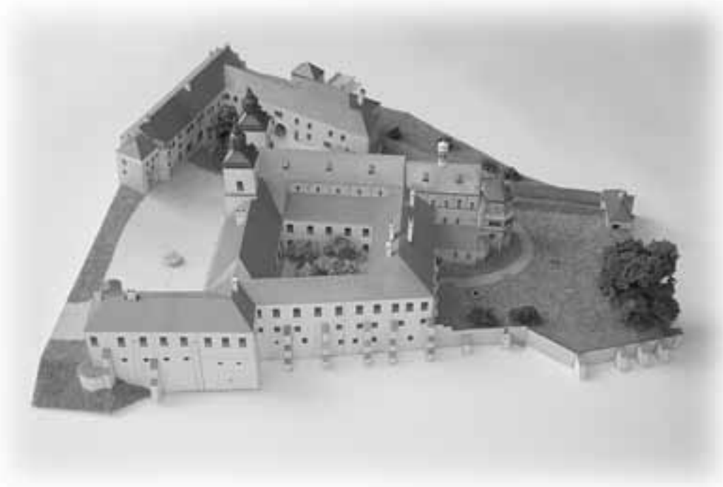
Papírový model třebíčského zámku - sídla Muzea Vysočiny Třebíč