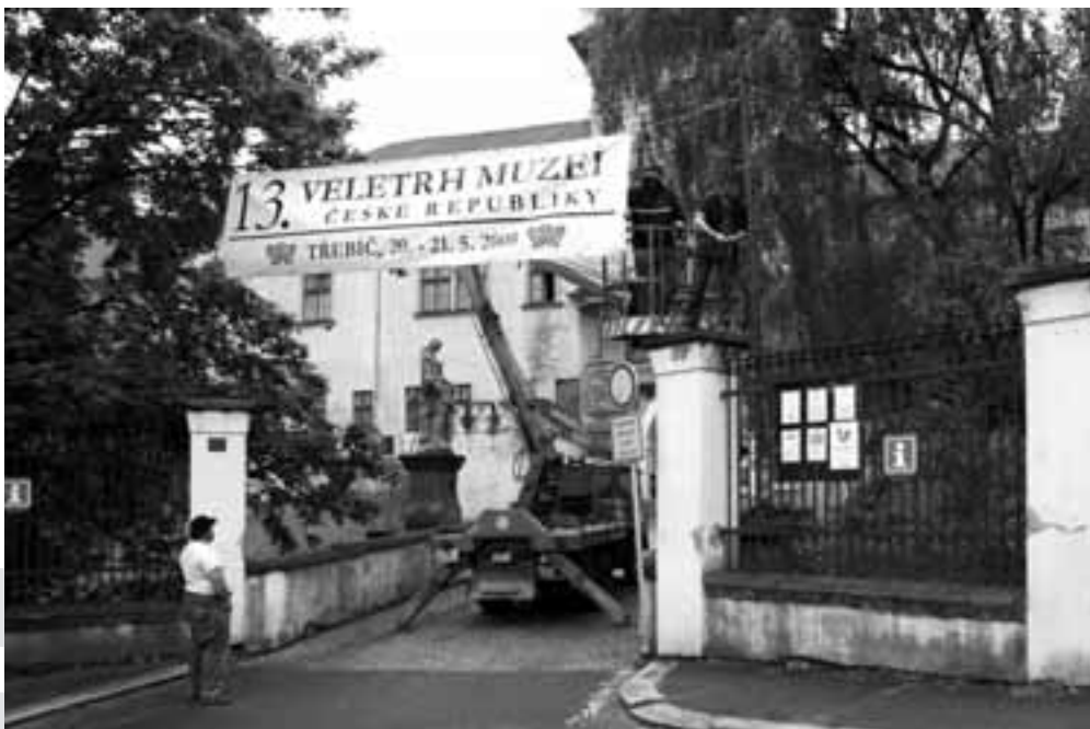
Vzpomínka na loňský ročník