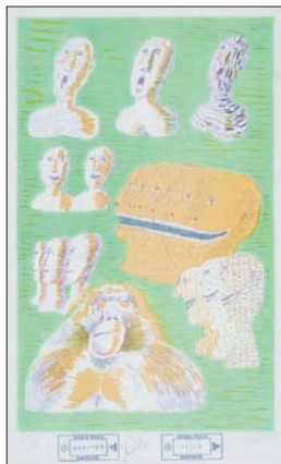
Jiří Sopko, HLAVY litografie, sign. a čisl. 35/90 39 x 24 cm vyvolávací cena: 100.000 Kč

Šek převezme Svetozár Martinický, správce Nadace Prameň