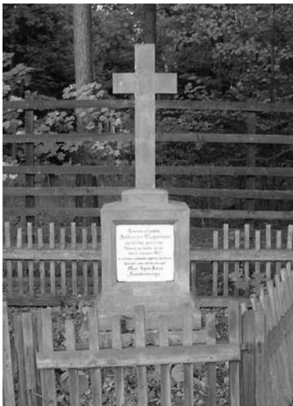
Kníže z Fürstenbergu.“

Ve dvacátém století vzniklo mnoho pomníků obětem první a druhé světové války a obětem nacismu. Snad každá česká vesnice má na návsi pomník občanům, kteří padli v první nebo druhé světové válce. Tyto pomníky se většinou nacházejí uprostřed návsi, jsou oploceny a kolem nich jsou vysázeny květiny nebo keře. Některé monumenty vznikly již za první republiky, jako například pomník padlým ve Skřivani, který byl v nedávné době opraven díky dotaci, kterou poskytl Mikroregion Balkán v rámci programu Obnova návsi. Upraveno bylo i okolí.