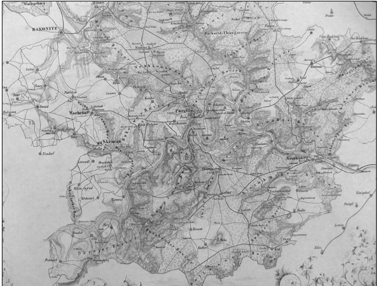
Generalkarte des Fürst zu Fürstenbergschen