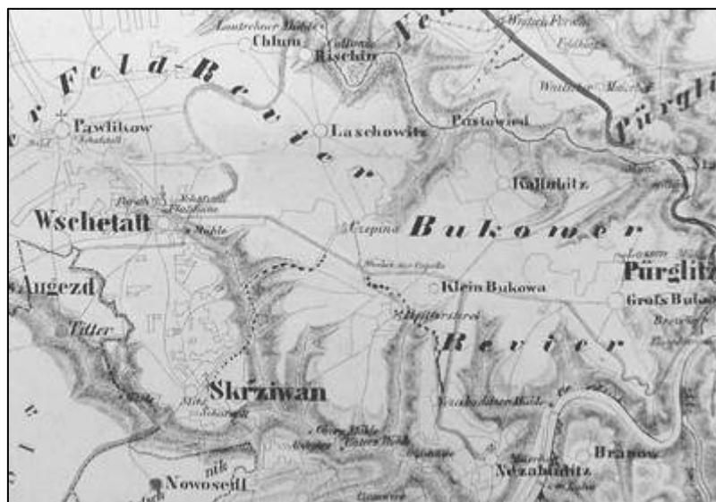
Situations-Plan der Fürst zu Fürstenbergschen

Velká Buková , původně Buková, byla založena patrně v 16. století. První zmínka o obci pochází z roku 1556. Buková byla postavena na místě vytěženého bukového lesa, které již nebylo znovu zalesněno. Pro potřeby Křivoklátska se zde dobývala síra. Manskou povinností vůči Křivoklátsku bylo posílat sedm mužů na koních nadhánět na lov, dva se psy, dva museli sloužit jako hajní. Všichni se pak museli starat o lovecké vozy a připravovat tenata. V 17. století byla do jejího správního celku přičleněna ves Kalubice, ve století 18. pak osada Malá Buková.