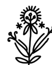
Příklady tradičních vzorů kraslic z Čech a Moravy.