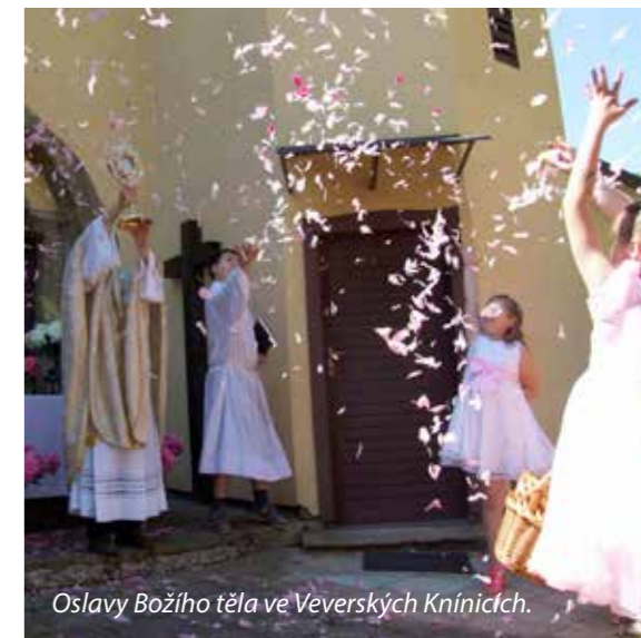
Oslavy Božího těla ve Veverských Knínicích.

Když jsem měla besedu o Tradinári v domově seniorů, vzpomněli si dědečkové a babičky právě na tento zapomenutý svátek. Vyprávěli mi, jak v dětství chodívali s průvodem a sypali z košíčku plátky růží a pivoňek. Vzpomínali na krásu květů, bílé šaty a také na své laskavé maminky, které si vybavili právě v souvislosti s tímto svátkem.