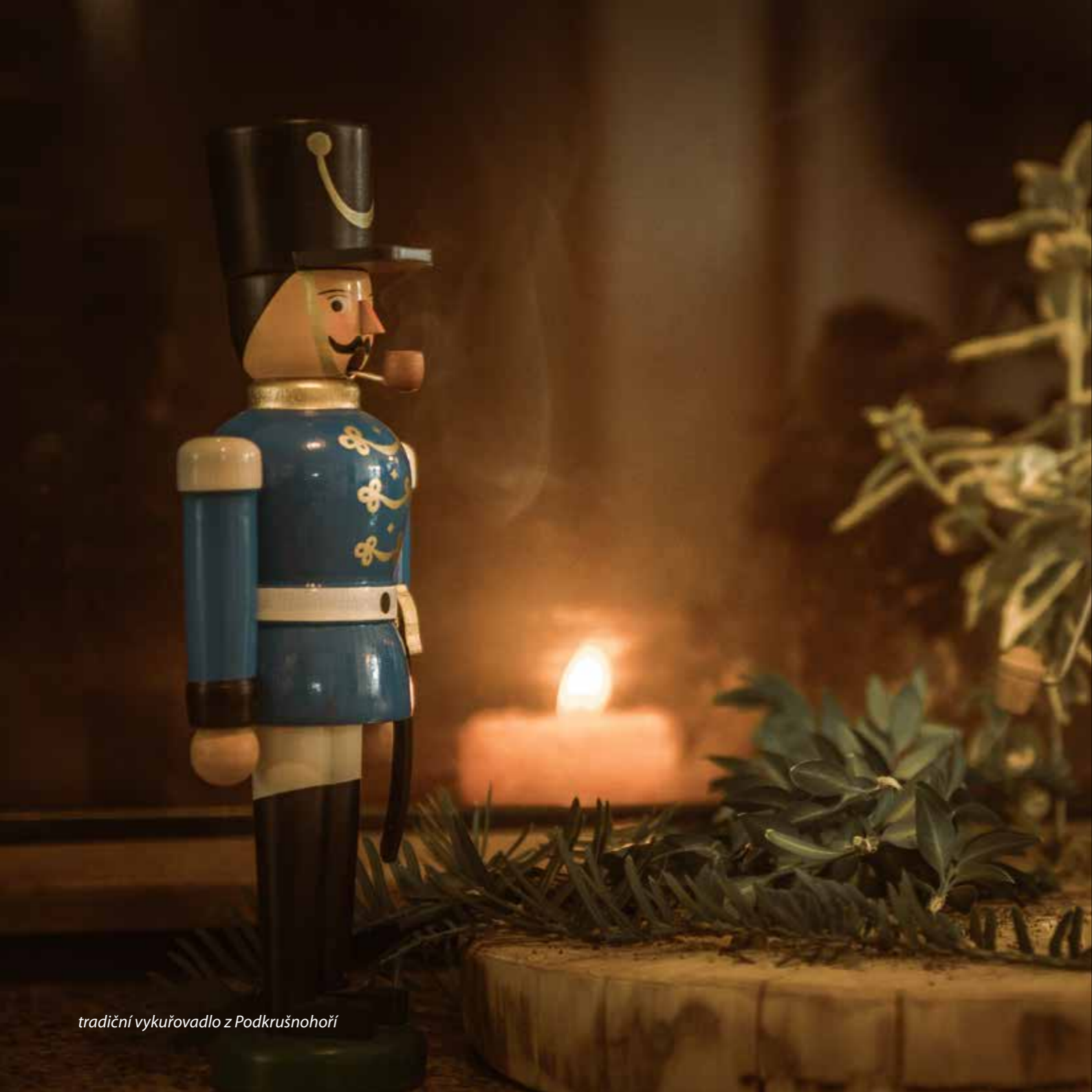
tradiční vykuřovadlo z Podkrušnohoří