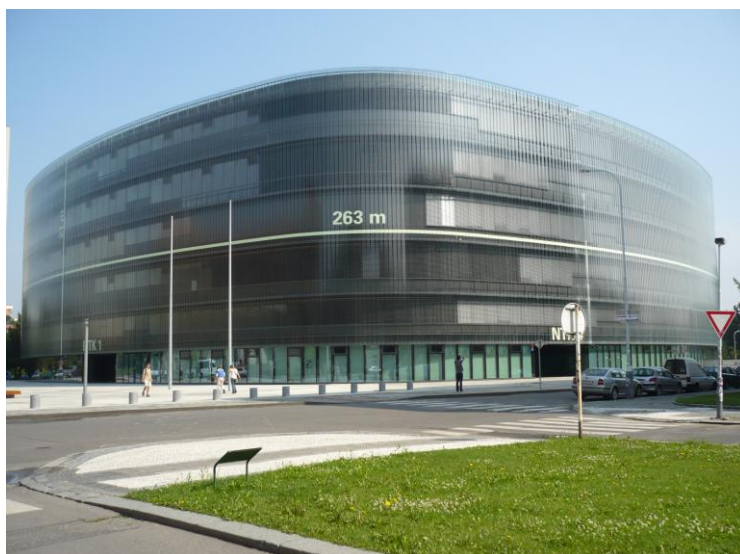
Obrázek 5 – Praha, Národní technická knihovna, Projektil, 2009

Jeden typ staveb se může pyšnit tím, že nabízí velké (většinou) novostavby. Tímto typem jsou – knihovny. Možná i proto, že musely opustit staré objekty, jež jim stejně již nevyhovovaly a které se vracely v restitucích. Knihovna se pro uplynulých 20 let stala asi nejvýraznějším moderním architektonickým typem. Knihovna nejen jako místo, kde jsou uloženy a kde se studují či půjčují knihy, ale knihovna jako nové společenské centrum, které počítá s výstavami, koncerty, s možností divadelních inscenací. Velké knihovny se staly ozdobou současné české architektury, sestaveno podle času: Státní vědecká knihovna a židovské kulturní centrum v Liberci (Radim Kousal, 2001), ve stejném roce Moravská zemská knihovna v Brně (Petr Benedikt, Tomáš Adámek), v roce 2009 Národní technická knihovna a Studijní a vědecká knihovna v Hradci Králové (obě od ateliéru Projektil architekti). K nim lze připojit stavby menší a neméně zajímavé, vzniklé rekonstrukcemi, ať je to knihovna v Pardubicích (Cuboid architekti, 2006) nebo původní knihovnu přestavěnou v rámci rekonstrukce rodného domu architekta Josefa Hoffmanna v Brtnici (Hrůša, Pelčák, 2003). S knihovnami souvisí zatím jediná stavba svého druhu, kterou jsem u nás zaregistrovala, a to mediátéka a komunitní centrum v Mokrém (Dimense architects, 2006), které představuje velmi nezvyklý úkol – vzniklo přestavbou opuštěné uhelné kotelny, kdy i z komína se stal nově pojatý architektonicky důležitý prvek.