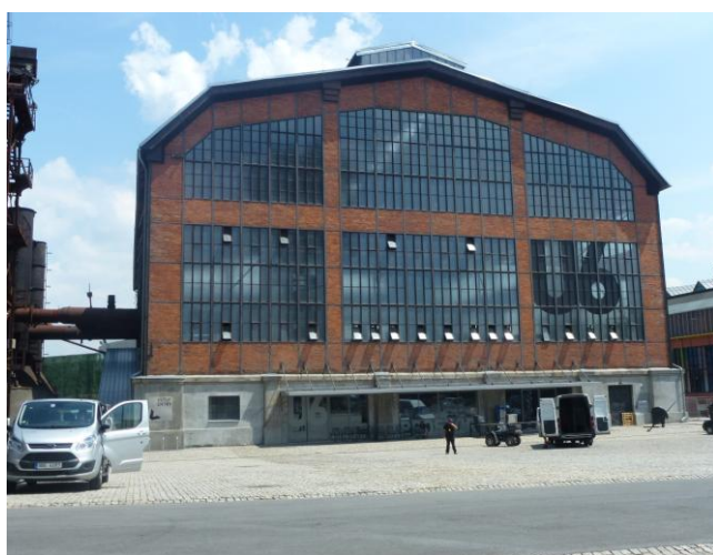
Obrázek 19 – Vítkovice, Malý svět techniky, zdeněk Fránek, 2013

Najdeme zde nový typ muzea, jakým je jednak zpřístupnění vyhaslých vysokých pecí, jednak Malý svět techniky v bývalé energetické ústředně (Zdeněk Fránek, 2013). Najdeme zde novostavbu muzea, jakou je Svět techniky (Josef Pleskot, 2014) a především víceúčelovou stavbu jménem Gong (Josef Pleskot, 2012), která vznikla z bývalého plynojemu. Vyzdvižením vrchlíku plynojemu do výšky 30 metrů vznikl prostor, do něž byla vložena samostatná železobetonová konstrukce, nabízející v několika podlažích prostory pro výstavy a další aktivity, a především velký sál, který je