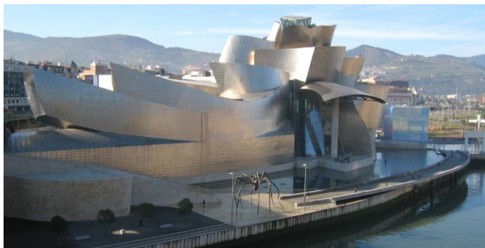
Obrázek 2 – Bilbao, Guggenheimovo muzeum (Frank Gehry, 1997)

A samozřejmě nejen u nás. Budeme-li mluvit o některých městech, obvykle nám velmi brzy vyvstane obraz významné stavby pro kulturu – Sydney a její Opera, Berlín a jeho Filharmonie, případně Nová národní galerie a nejnověji Kunstforum, Paříž a její centre Pompidou, Londýn a Tate Modern, o Bilbao a jeho Guggenheimově centru ani nemluvě.