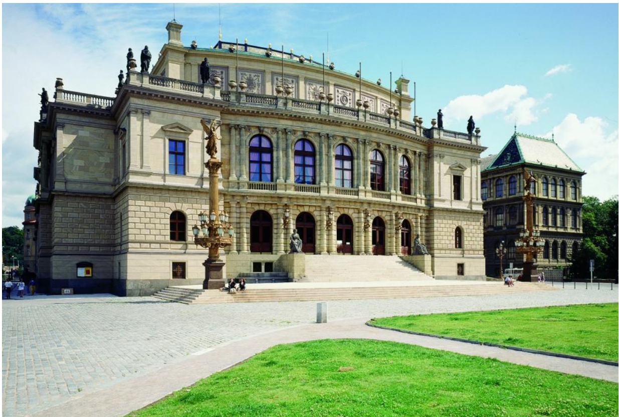
Obrázek 3 – Praha, Rudolfinum (J. Zítěk, J. Schulz, rekonstrukce K. Prager 1993)

V roce 1993 byla také ustavena soutěž Stavba roku, v jejímž prvním ročníku se mezi pět nositelů titulu dostala rekonstrukce pražského Rudolfinu (projekt rekonstrukce: Karel Prager). Stavby pro kulturní aktivity od té doby obě soutěže provázejí každoročně a poměrně dost úspěšně, což ukazuje na to, že architekti, stejně jako stavaři si těchto staveb váží, zpracovávají je s odpovědností odpovídající tradici tohoto typu staveb.