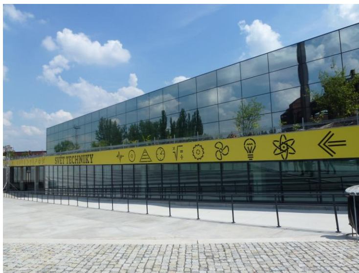
Obrázek 18 – Vítkovice, Svět techniky-Science and technology Center, Josef Pleskot, 2014

Na závěr, neboť nelze vypočítat všechny stavby pro kulturní aktivity, které architektura za posledních 25 let nabídla, jsem si nechala asi nejvýraznější počín poslední doby, kterým je proměna oblasti Dolních Vítkovic na kulturní centrum.