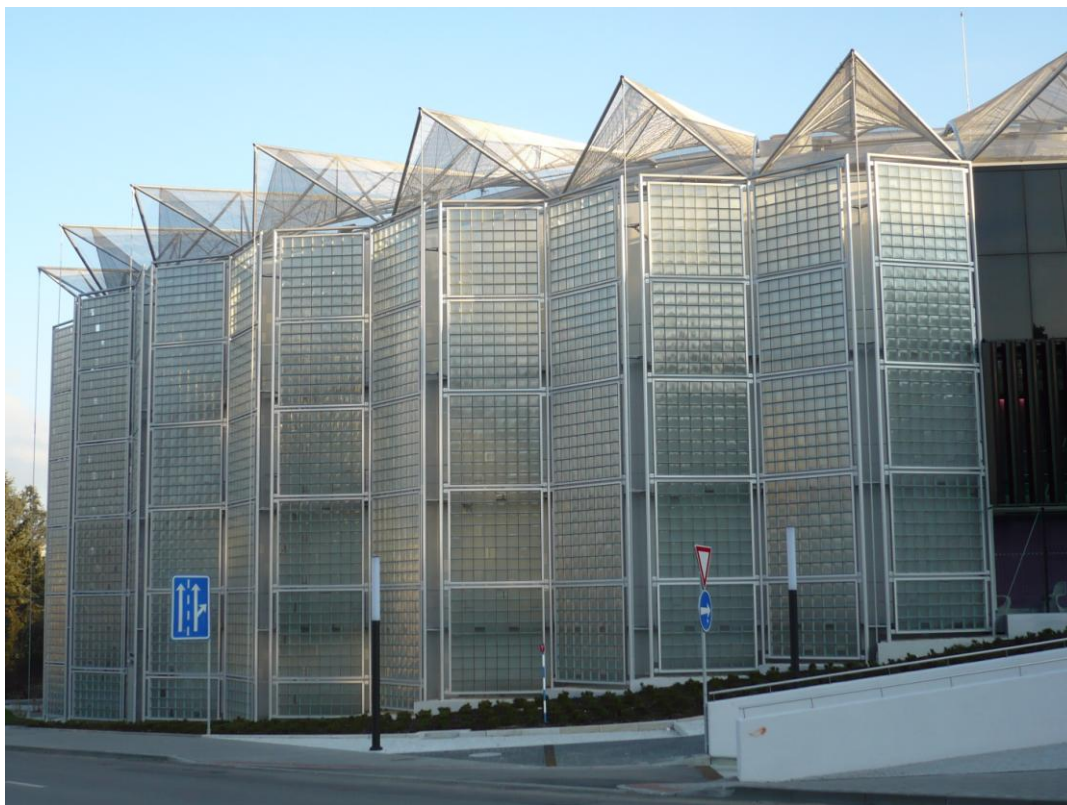
Obrázek 9 – Zlín, Kongresové centrum, Eva Jiříčná

Vlastně byly nově vytvořeny dva, koncertní sál Pražské konzervatoře (Domkář, Sehyl, 2009) a sál pro Filharmonii Zlín, skrývající se pod názvem Kongresové centrum (Eva Jiříčná, 2011), jehož architektonické řešení je ovšem spíše rozpačitě přijímáno ... Koncertní síně pro Prahu či Brno jsou v nedohlednu, byť to jsou pro architekty velmi zajímavá témata, zpracovávaná už mnoho let ... Stejně tak do nedohledna, zdá se, odplouvá Rejnok v Českých Budějovicích, efektní skica navržená Janem Kaplickým (2009).