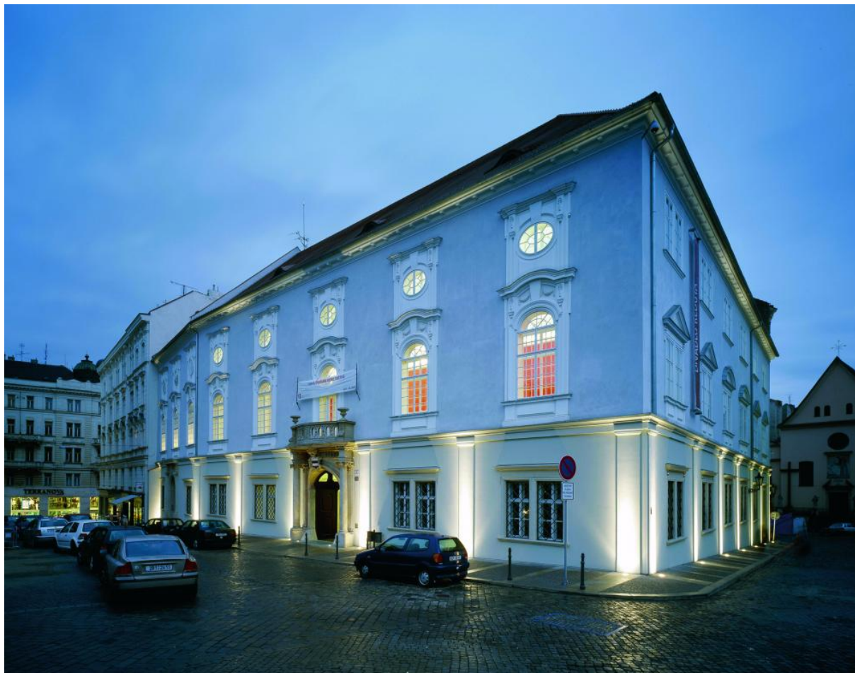
Obrázek 8 – Brno, Reduta , DRHN

Laterny magiky ve špičkovou ukázkou tzv. bruselského stylu (František Cubr, Josef Hrubý, Zdeněk Pokorný, 1960), aby v 90. letech bylo znovu rekonstruováno pro potřeby divadla Bez zábradlí ... Stranou nelze ponechat obnovu brněnské Reduty (ateliér DRHN, 2006), vlastně nejstarší samostatné divadelní budovy u nás.