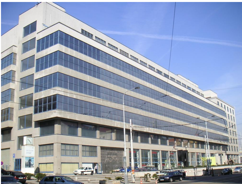
Obrázek 11 – Praha, Veletržní palác, rekonstrukce M. Masák, 1995

Samostatnou kapitolou jsou stavby pro výstavní aktivity, ať pro státní sbírky či pro soukromé galerie. Začalo to v roce 1993 dostavbou a v roce 1995, 19 let po požáru otevřením Veletržního paláce pro potřeby Národní galerie (Miroslav Masák).