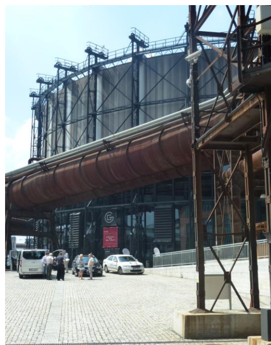
Obrázek 20 – Vítkovice, Gong, Josef Pleskot, 2013