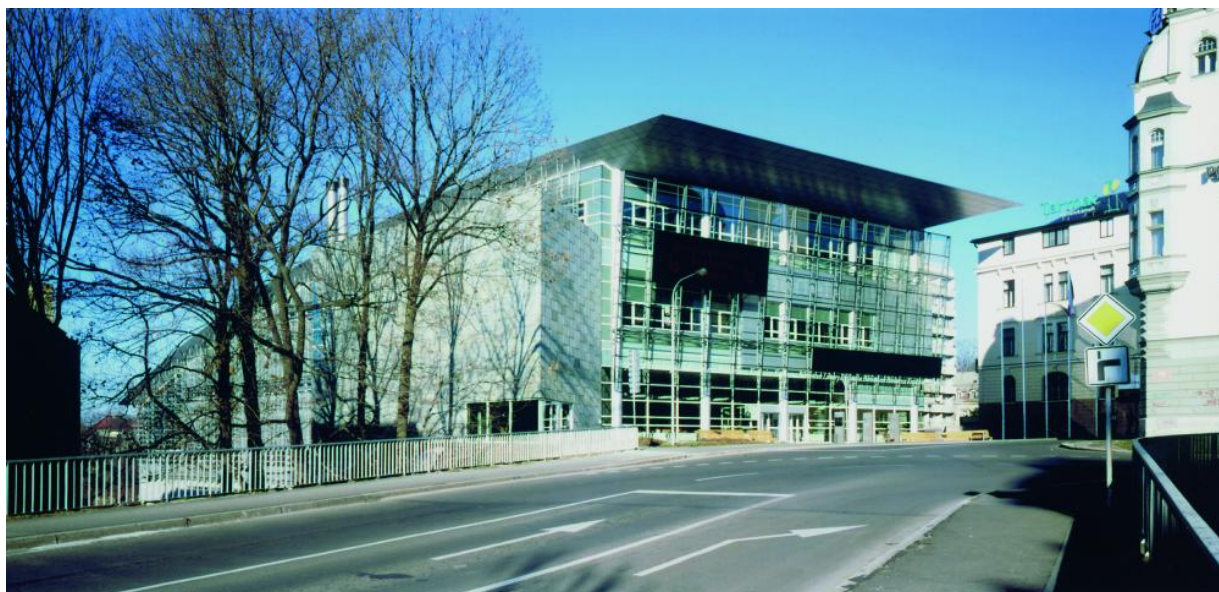
Obrázek 4 – Liberec, Státní vědecká knihovna a židovské kulturní centru, Radim Kousal, 2001

Jeden typ staveb se může pyšnit tím, že nabízí velké (většinou) novostavby. Tímto typem jsou – knihovny. Možná i proto, že musely opustit staré objekty, jež jim stejně již nevyhovovaly a které se vracely v restitucích. Knihovna se pro uplynulých 20 let stala asi nejvýraznějším moderním architektonickým typem. Knihovna nejen jako místo, kde jsou uloženy a kde se studují či půjčují knihy, ale knihovna jako nové společenské centrum, které počítá s výstavami, koncerty, s možností divadelních inscenací. Velké knihovny se staly ozdobou současné české architektury, sestaveno podle času: Státní vědecká knihovna a židovské kulturní centrum v Liberci (Radim Kousal, 2001), ve stejném roce Moravská zemská knihovna v Brně (Petr Benedikt, Tomáš Adámek), v roce 2009 Národní technická knihovna a Studijní a vědecká knihovna v Hradci Králové (obě od ateliéru Projektil architekti). K nim lze připojit stavby menší a neméně zajímavé, vzniklé rekonstrukcemi, ať je to knihovna v Pardubicích (Cuboid architekti, 2006) nebo původní knihovnu přestavěnou v rámci rekonstrukce rodného domu architekta Josefa Hoffmanna v Brtnici (Hrůša, Pelčák, 2003). S knihovnami souvisí zatím jediná stavba svého druhu, kterou jsem u nás zaregistrovala, a to mediátéka a komunitní centrum v Mokrém (Dimense architects, 2006), které představuje velmi nezvyklý úkol – vzniklo přestavbou opuštěné uhelné kotelny, kdy i z komína se stal nově pojatý architektonicky důležitý prvek.