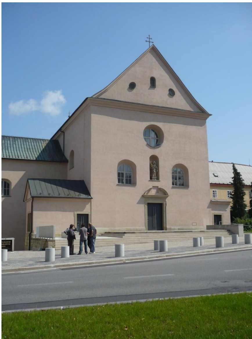
Obrázek 13 – Chrudim, Muzeum barokní plastiky, Projektíl, 2012

K těmto typům staveb je žádoucí připomenout i využití církevních staveb, které již neslouží svému účelu – Muzeum barokních soch vzniklo v klášteře v Chrudimi (Projektíl, 2012), Památník moravského písemnictví v klášteře v Rajhradě (Radko Květ, 2005). Zajímavě multifunkčně je využíván nedávno dokončený soubor prelatury v Mariánské Týnici, kde kromě muzea je především bývalý kostel využíván pro výstavy, performance a další mnohožánrové akce. Zvláště bývalé klášterní stavby se pro takovou funkci hodí znamenitě, ale jejich množství a jejich umístění přesahuje asi možnosti současného českého kulturního dění (a financí).